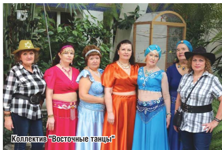
Коллектив «Восточные танцы»