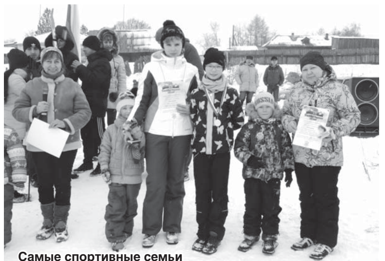
Самые спортивные семьи

ТРЕБУЮТСЯ ТРЕБУЮТСЯ ТРЕБУЮТСЯ ТРЕБУЮТСЯ ТРЕБУЮТСЯ ТРЕБУЮТСЯ