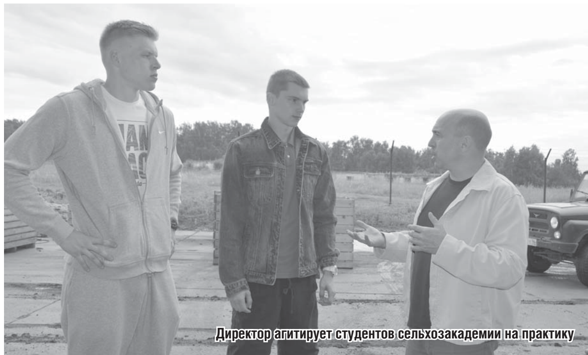
Директор агитирует студентов сельхозакадемии на практику