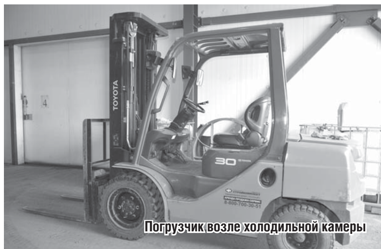
Погрузчик возле холодильной камеры

Сети просят всю линейку овощей, условно говоря – борщовой набор: картофель, морковь, свекла, капуста, лук. То, что