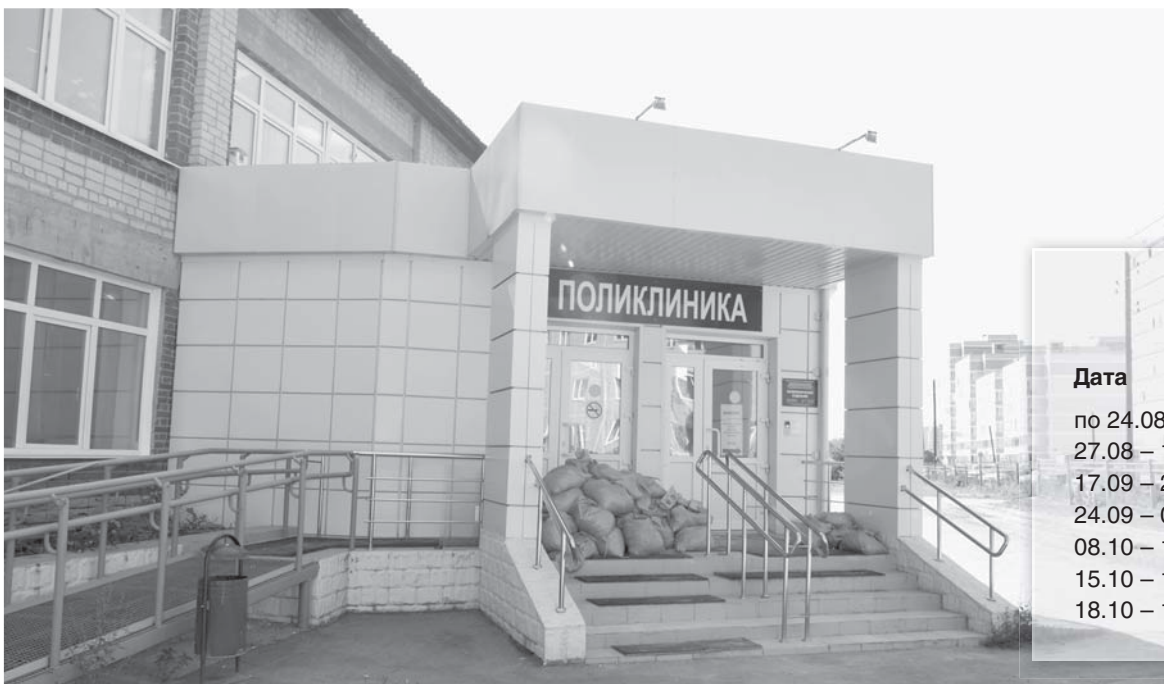
ГРАФИК РАБОТЫ ПЕРЕДВИЖНОЙ ФЛЮОРОГРАФИЧЕСКОЙ УСТАНОВКИ: