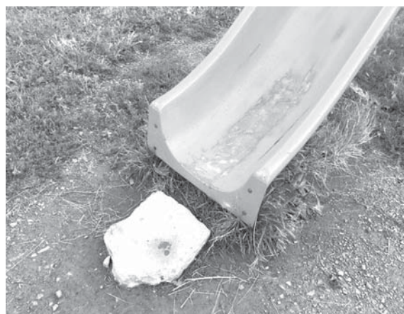
Горка у дома N60 по ул. Орджоникидзе. Сломаны выступы для подъема, кусок бетона.