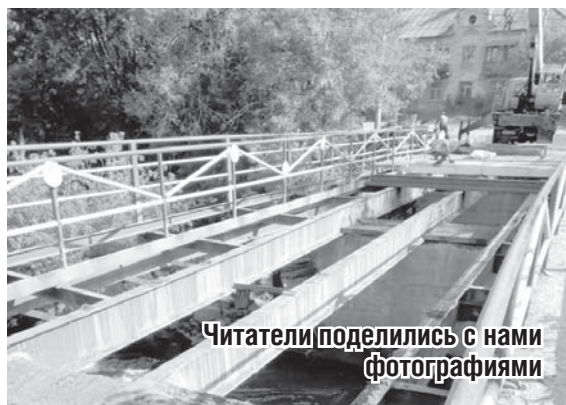
Читатели поделились с нами фотографиями

Большее спасибо заждались ремонта. И вот, в понедельник, 27 августа, на мосту началась работа.