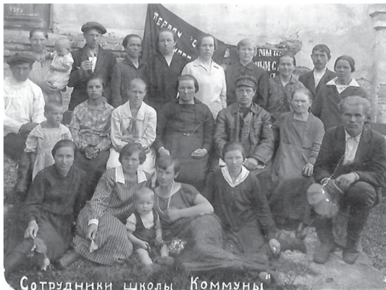
Сотрудники школы «Коммуны»

Ваши сведения могут оказаться полезными не только для доклада, но и с точки зрения восстановления одной из страниц истории нашего города.