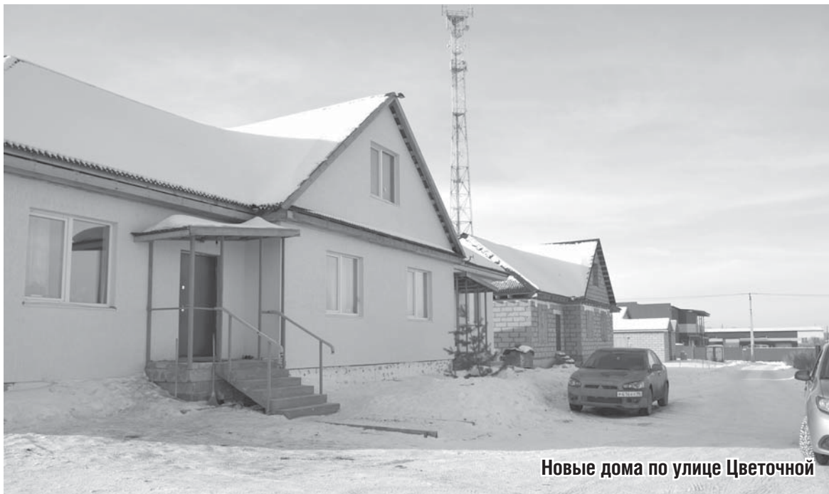
Новые дома по улице Цветочной

Однако 11 июля 2017 года главой СГО А. Г. Карамышевым подписано постановление N344 о предоставлении разрешения на условно разрешенный вид использования «для