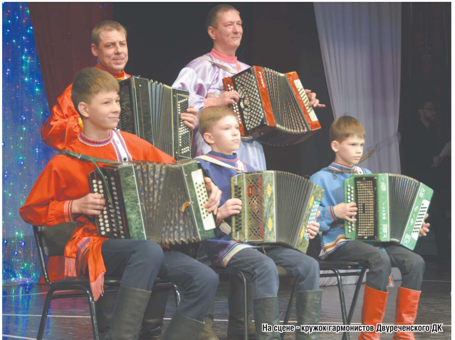
На сцене - кружок гармонистов Двуреченского ДК