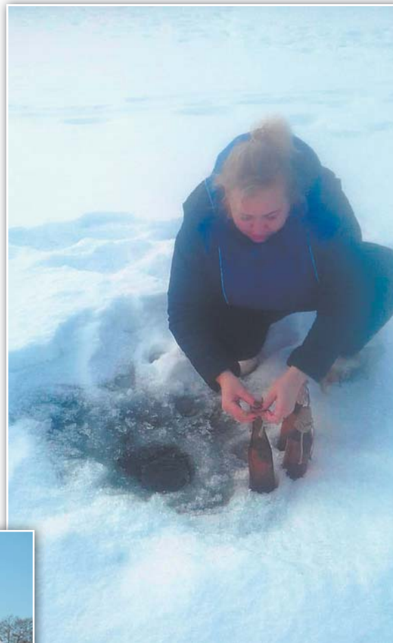
Взятие пробы воды