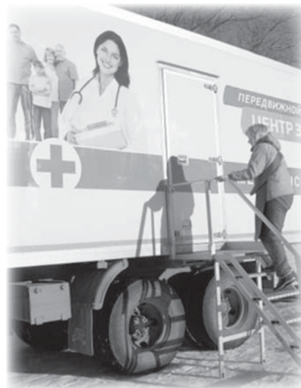
Подготовила Татьяна Кремлева.