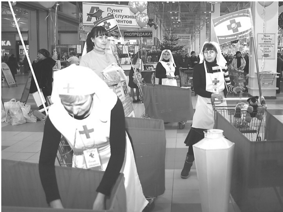
Участники акции собирают товары, пожертвованные покупателями.