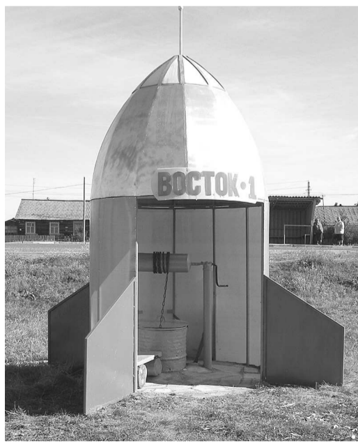
Августовская «новостройка» в Гарашкинском.