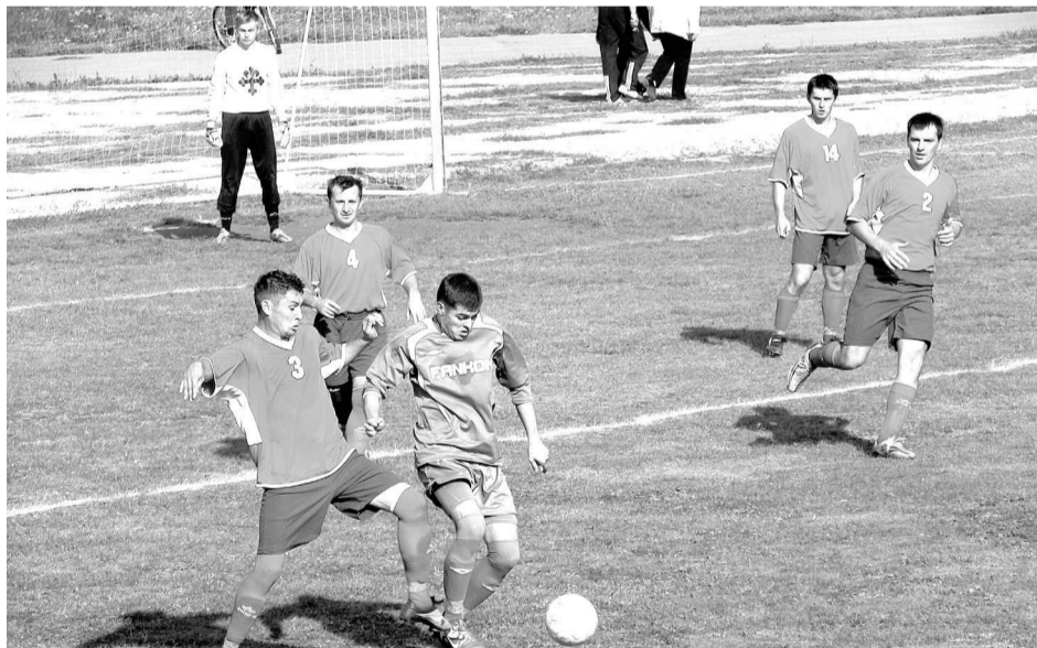
Фрагмент матча команд «Факел» (Богданович) и «Фанком» (Алапаевск).