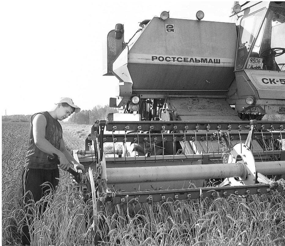
На краткосрочный ремонт остановился работник КХ «ИП Степанов О.Н.» М.П. Селин.