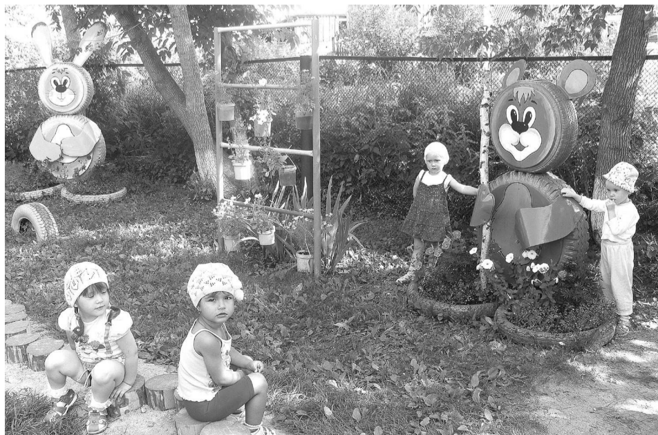
На участке второй младшей группы Тыгшского детсада сказочные герои радуют детей.