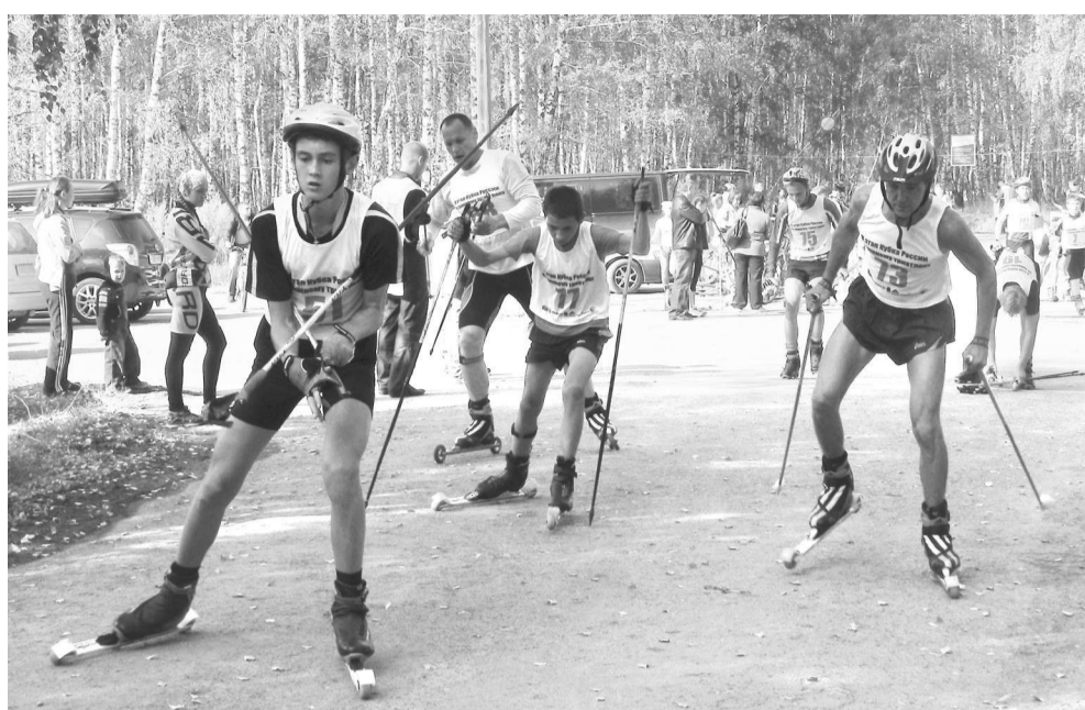
Третий этап триатлона — пять км на лыжероллерах.