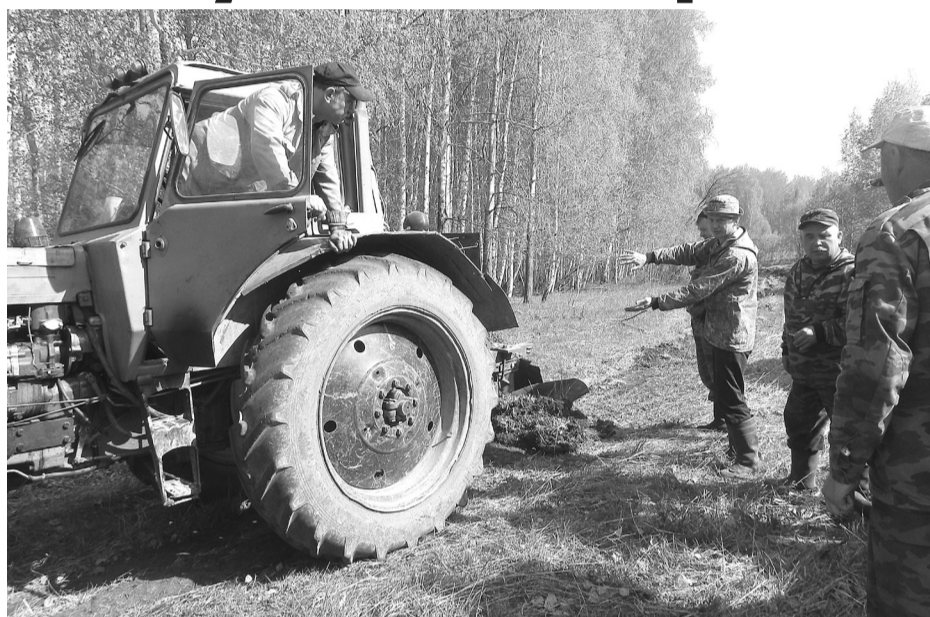
Работники Богдановичского участкового лесничества и Сухоложского лесхоза на создании минполос.