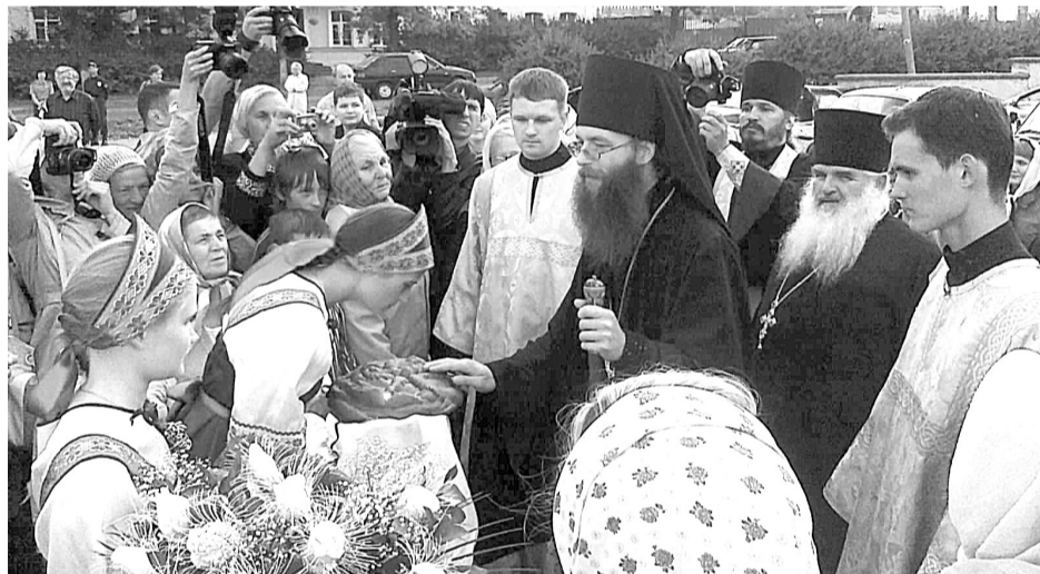
На встречу с епископом Каменским и Алапаевским пришло много верующих.

9 сентября 2011 года духовенство городского округа Богданович, Сухого Лога, Камышлова, Асбеста и остальных приходов, вошед-