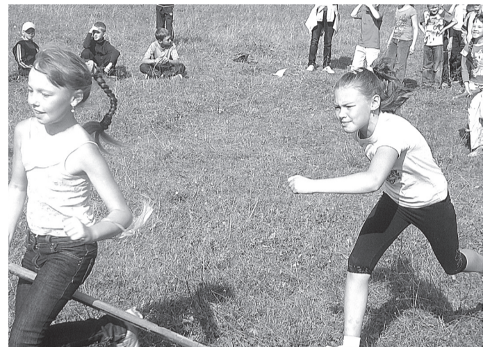
Ученикам школы № 3 на турслете было не до скуки.

Хочется выразить благодарность всем, кто принимал участие в организации тури-