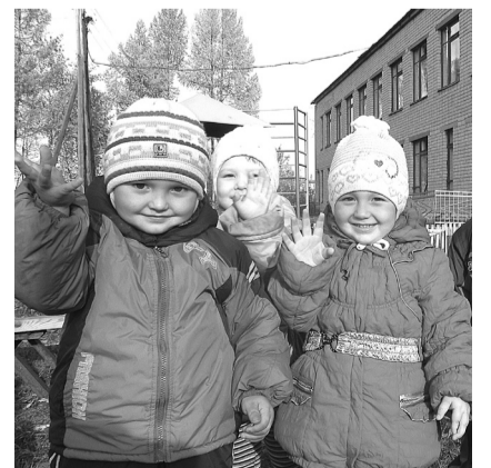
Малыши в садике не скучают.

Но и молодыми кадрами коллектив пополняется. За последние два года устроились на работу три молодых специалиста.