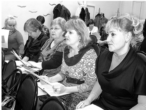
Заведующие детскими садами и директора школ были ознакомлены с итогами проверок.

Во-первых, учреждениям образования следует проверить на соответствие СанПиНу питьевые фонтанчики, установленные для организации питьевого режима школьников. Во-вторых, внимательней относиться к приемке товара: сразу выявлять случаи поставки недоброкачественной продукции, а принимая товар, складывать его на подтоварники, а не на пол. Соблюдать товарное соседство, это, в-третьих. То есть, к примеру, там, где хранится хлеб, больше ничего не должно лежать. Были названы и другие выявленные нарушения.