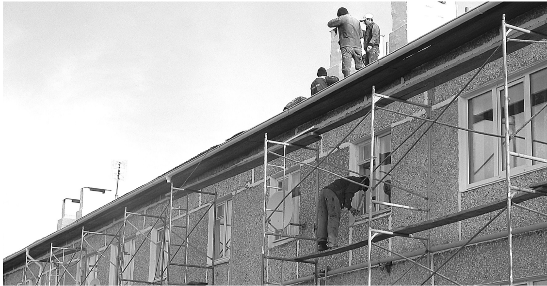
Пять из семи многоквартирных домов Коменок ремонтируются сегодня.

– К сожалению, численность поголовья скота год от года уменьшается. Наверное, сказывается близость села к городу. Но коров сельчане все же держат. Сегодня на территории насчитывается 52 головы крупного рогатого скота, в том числе 22 коровы (для сравнения: в 2009 году