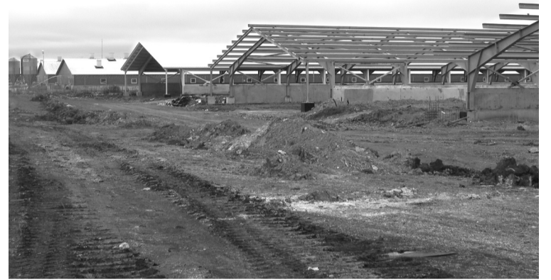
ЗАО «Свинокомплекс «Уральский» расширяет производственные площади.

газификации этих улиц ожидается в следующем году.