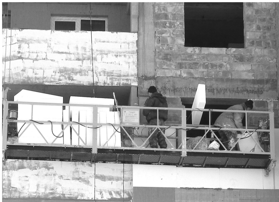
Работники «УралЭнерго-инжиниринга» производят утепление фасада второй секции дома № 9 на улице Кунавина.