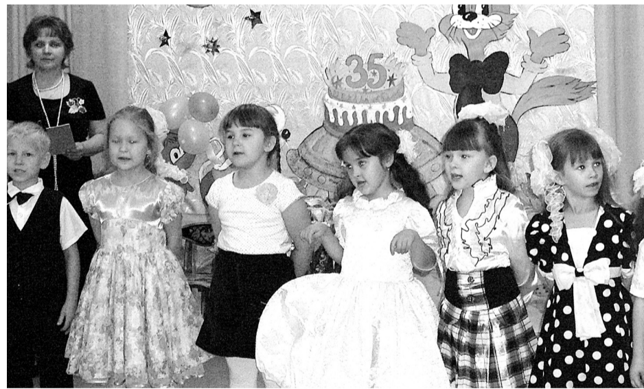
Воспитанники детского сада читали стихи и исполняли песни.