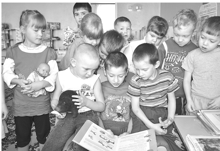
Старшая подготовительная группа детского сада.