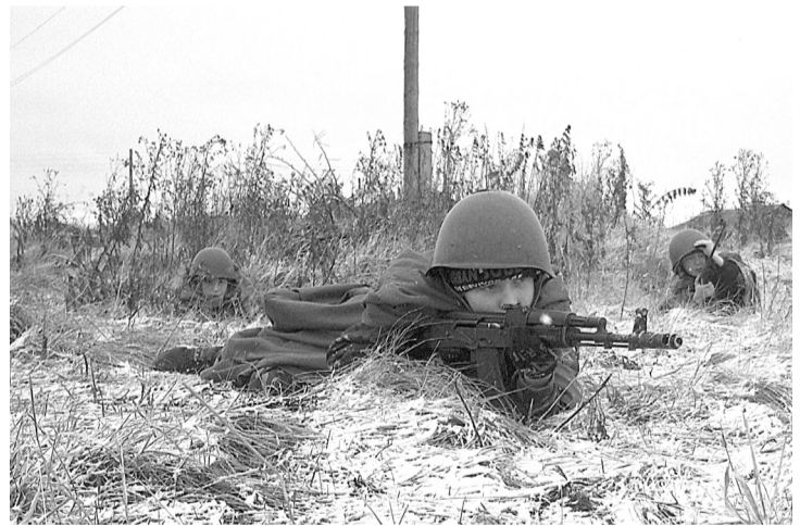
Казачата на полевой игре «Пластун».

С ребятами занимались учителя Ильинской школы. Они провели мастер-класс «Русская изба», в ходе которого дети собственными руками изготовили макеты изб;