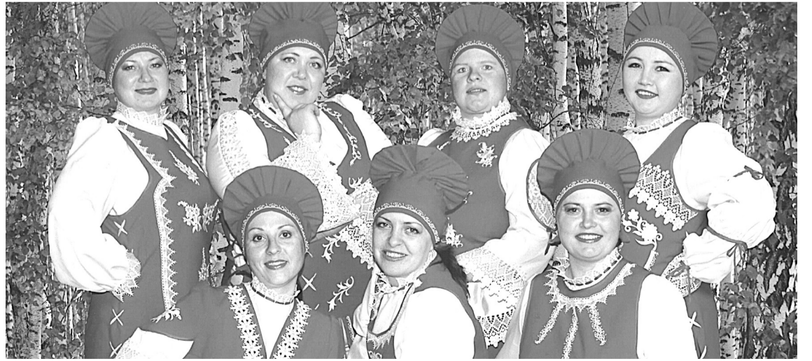
Ансамбль народной песни «Любава».