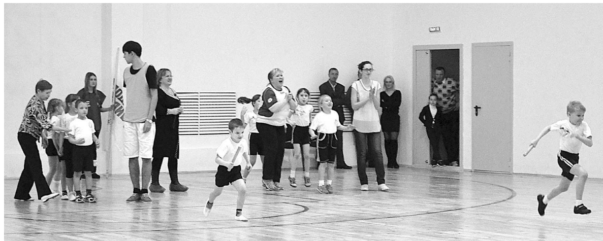
Воспитанники детских садов с удовольствием участвовали в «Веселых стартах».