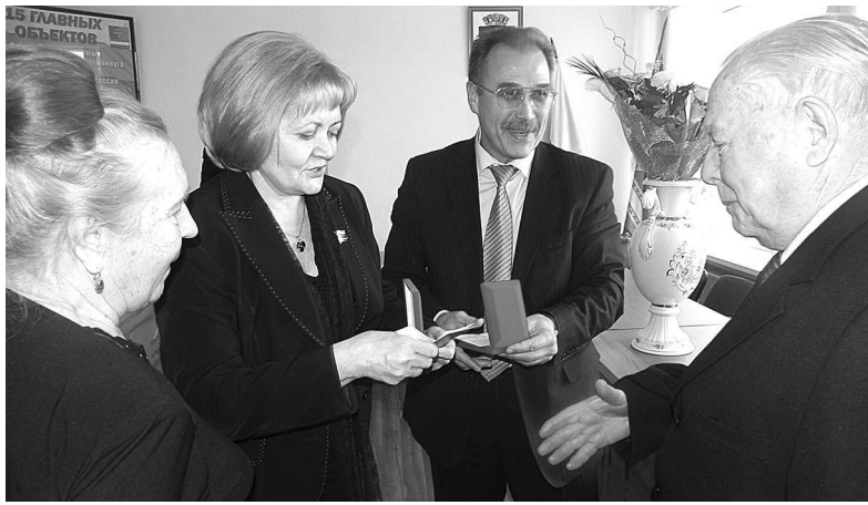
С. ФЕДОСЕЕВА. Фото автора.

С 1 января 2012 года вступят в силу изменения, внесенные в закон N 111 по инициативе общественности. Пункт «наличие государственных наград у детей супругов» исключен. А это значит, что право на присвоение этого знака отличия появится у многих пар – долгожителей нашего района.