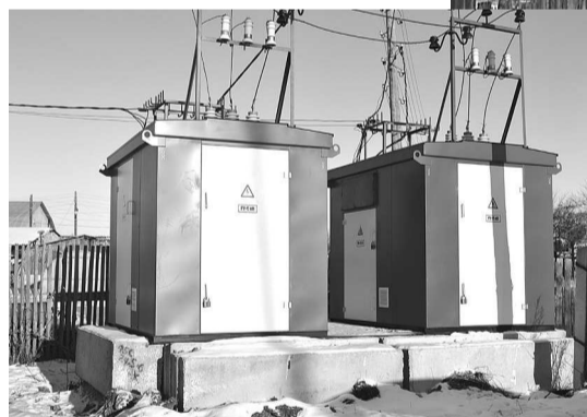
Новая двоярная ТП на улице Бажова.