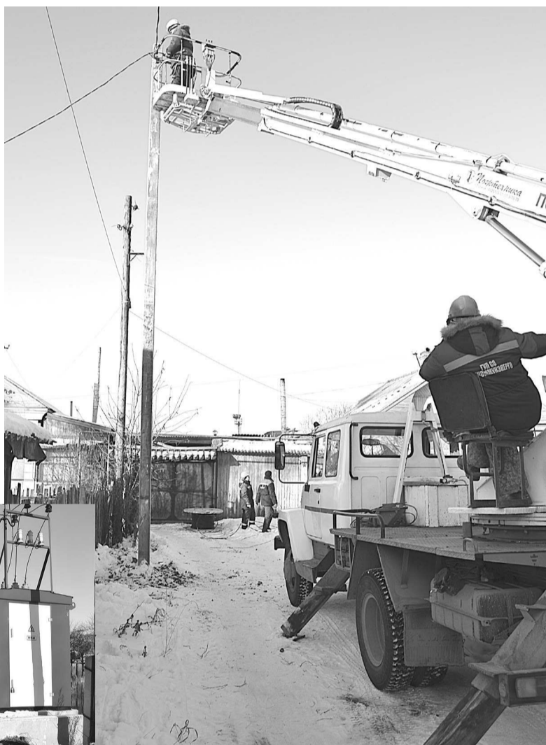
Идет замена линии электропередач на улице Пургина.