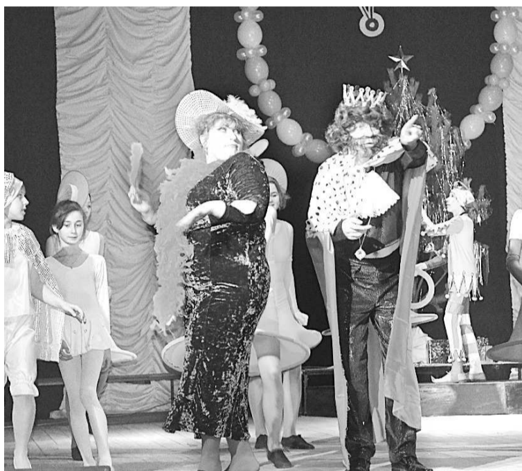
Забавный король и злая мачеха развлекали детей своими шутками.