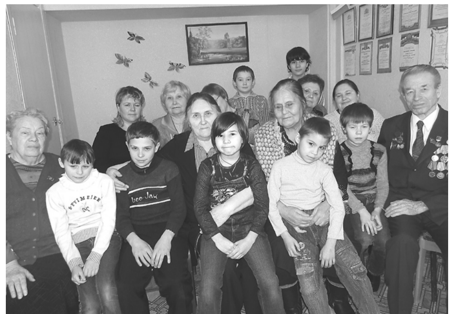
Два поколения встретились в совете ветеранов.