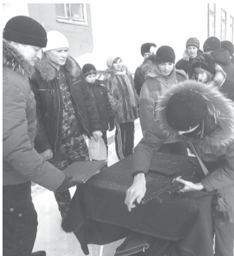
Разбирать и собирать автомат на улице не так уж и просто.