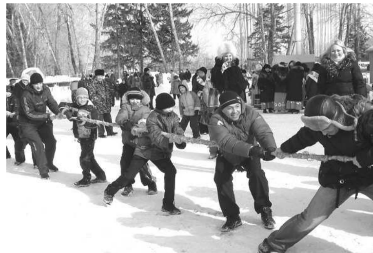
Многие хотели показать свою силу и удал в перетягивании каната.