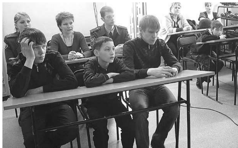
Дети с интересом слушали о деятельности ДОСААФ.