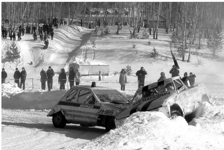
Удары автомобилей приводили зрителей в полный восторг.