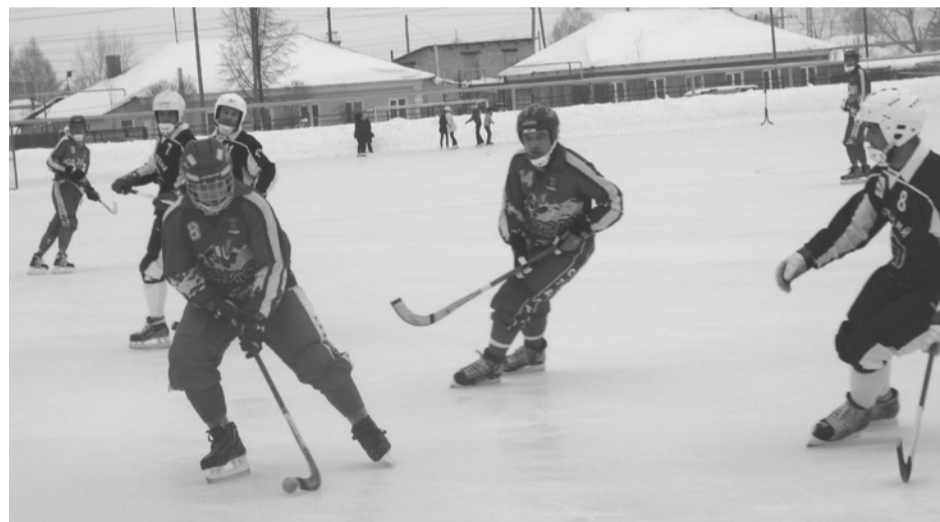
Фрагмент одного из матчей «Факела» в нынешнем сезоне. Соперники – команда «Строитель» из Сыктывкара.

Конечно, хотелось бы иметь свой искусственный лед. В качестве примера возьмем детские хоккейные команды Красноуральска и Первоуральска. Они начинают кататься на льду с августа и заканчивают в апреле. То есть проводят на коньках по восемь месяцев, в то время как наши дети в лучшем случае – 4–5 месяцев. Несмотря на это, победы у нас есть, но даются они нелегко.