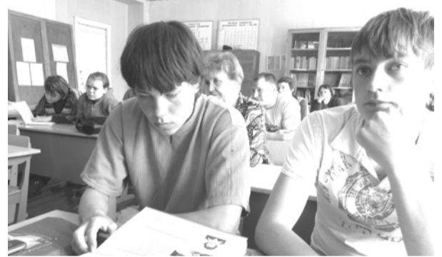
Ученики вечерней школы внимательно слушали гостей.