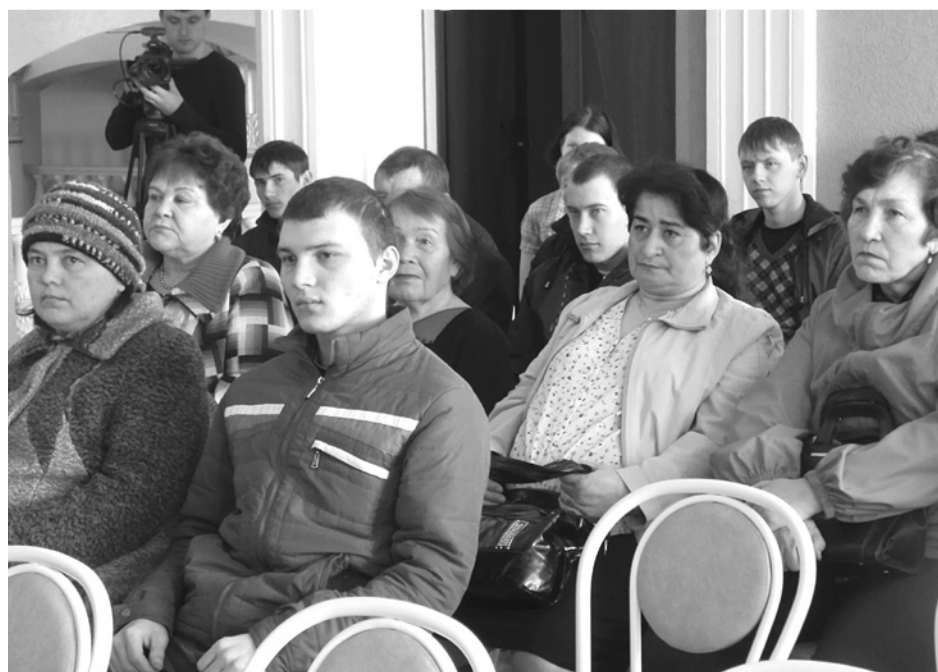
Призывники и их родители внимательно слушали выступающих.