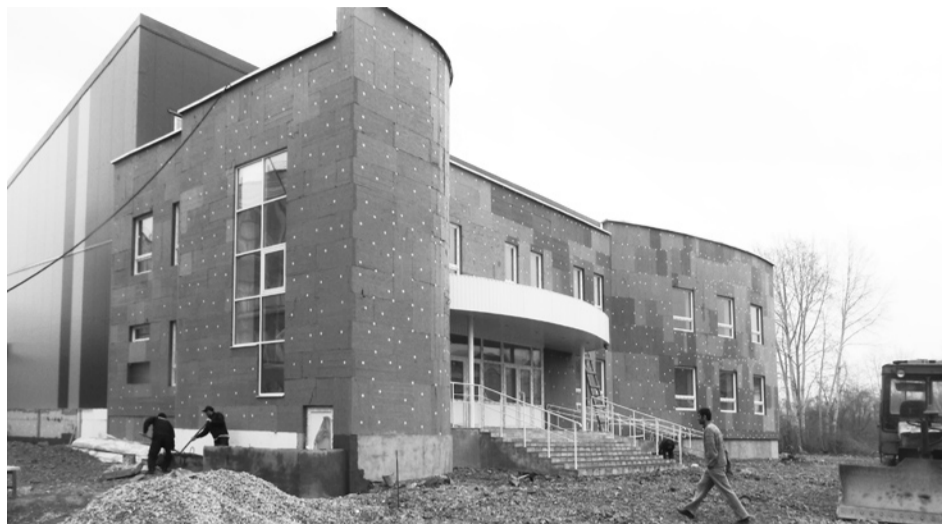
Рабочие ООО «Стройколорит» (г. Екатеринбург) ведут активную работу как внутри, так и снаружи спорткомплекса.

Строительство второй очереди (бассейна) начнется уже в нынешнем году, в частности, будет заложен фундамент. А вот его ввод в эксплуатацию пока намечен на будущий 2012 год. Как это удастся реализовать, покажет время, по крайней мере, будет сделано все, что в наших силах. Финансирование строительства этой части комплекса предполагает реализацию 269 миллионов рублей.