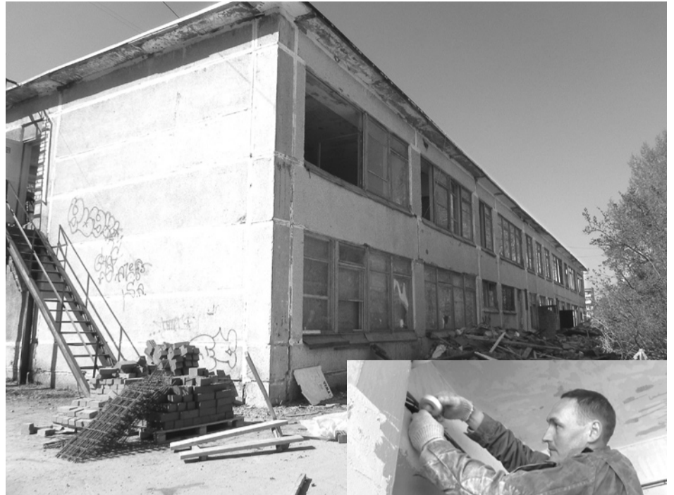
Реконструкция детсада № 38 идет полным ходом.