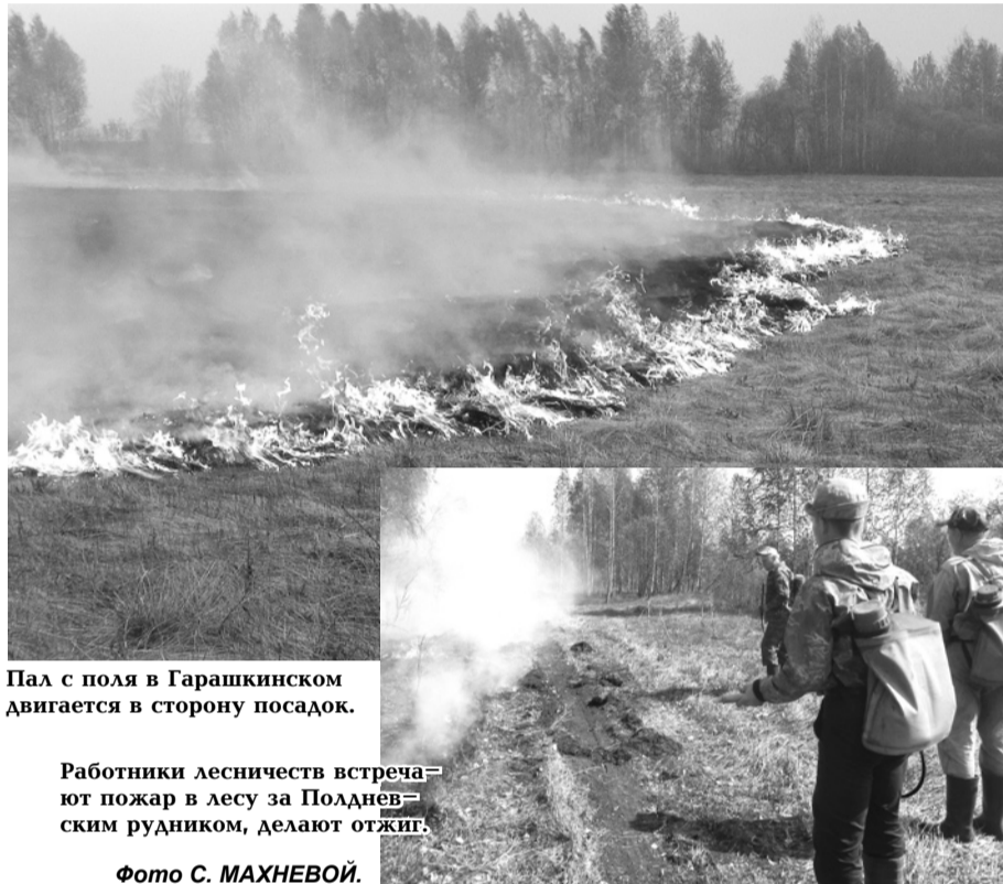
Пал с поля в Гарашкинском двигается в сторону посадок.

ПН, 23 мая: утро +10°, вечер +19°, ск. ветра - 2 м/с (С-З).