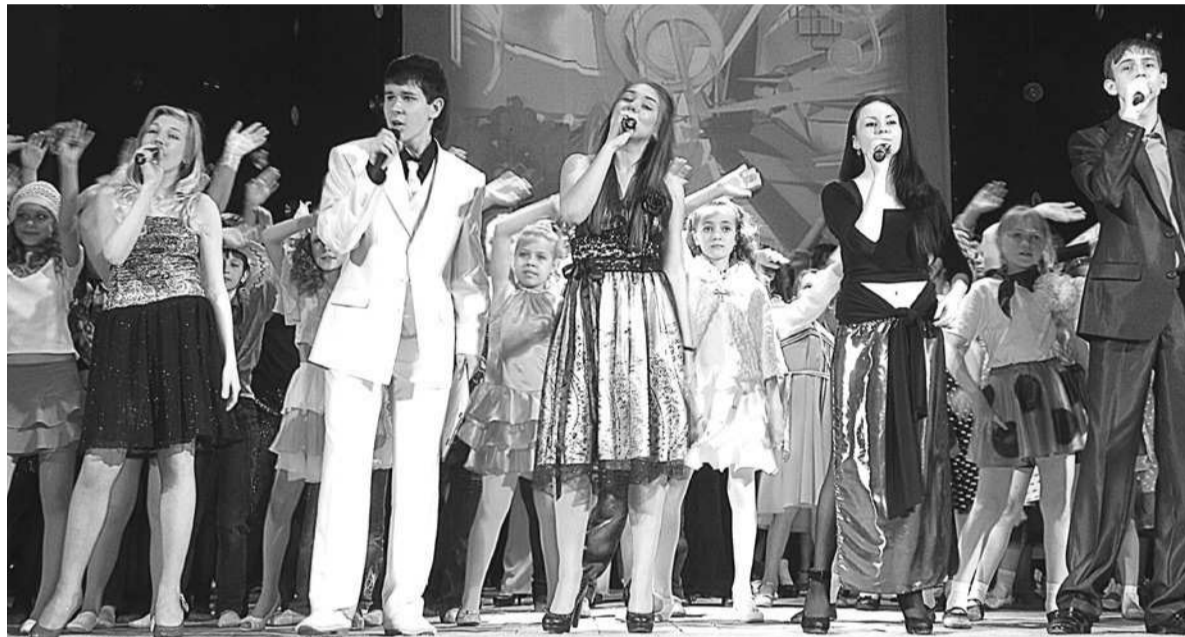
Фестиваль «Успех» объединил всех талантливых детей нашего округа.