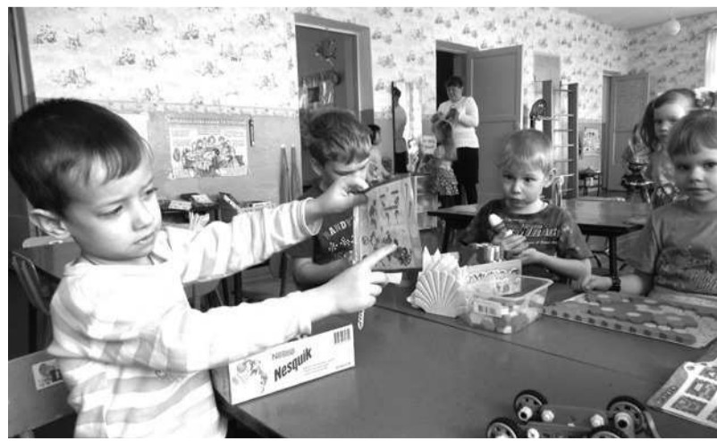
В Ильинском детском саду планируется открытие второй группы.