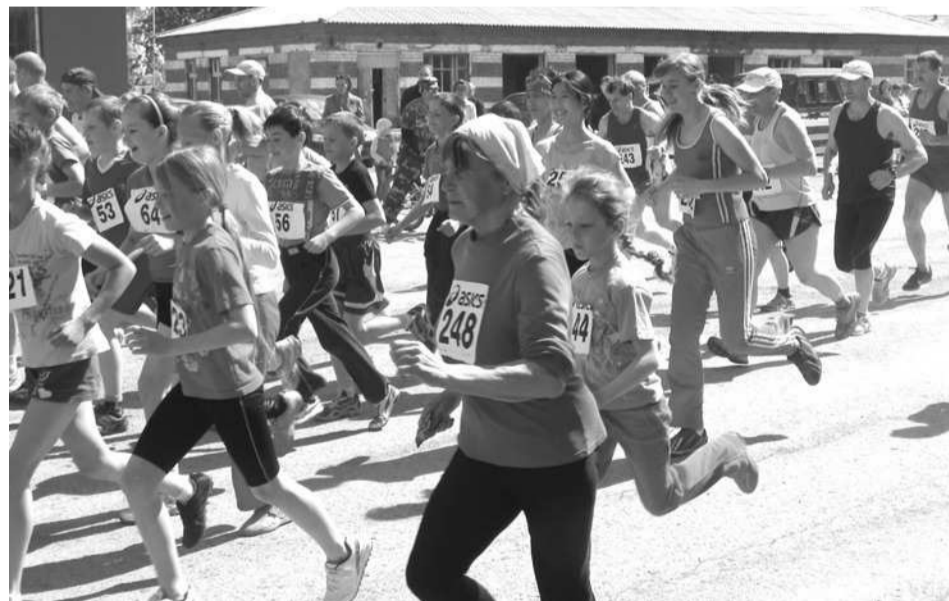
Участники легкоатлетического пробега стартовали одновременно, независимо от возраста.