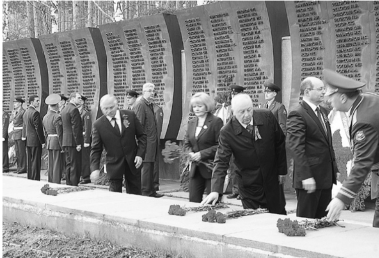
НА СНИМКЕ: возложение цветов на Ширококореченском кладбище.

ники провел при поддержке Законодательного Собрания Свердловской области международный турнир по хоккею с шайбой среди юношей, посвященный Дню Победы, с участием сильнейших команд из Новосибирска, Новокузнецка, Уфы, Астаны, Екатеринбурга.