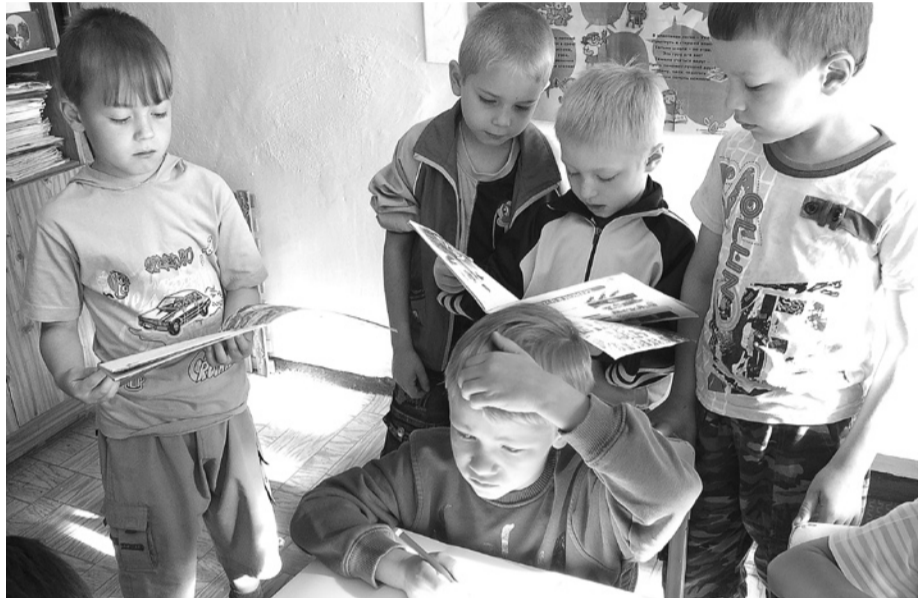
Лагерь – это друзья, игры и увлечения.