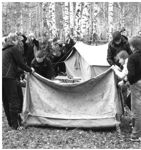
Туристы собирают палатку на время.

Погода для слета была самой благоприятной,