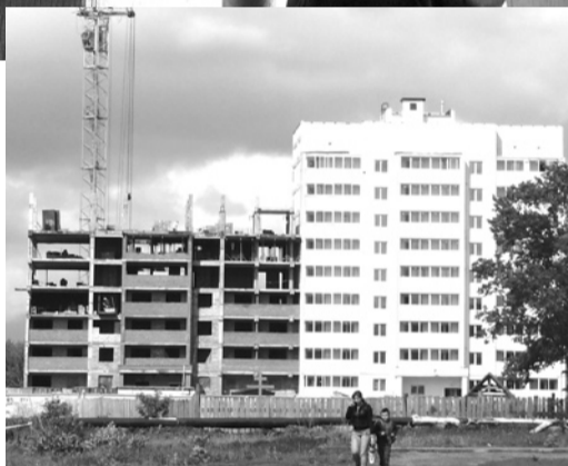
Ведется монтаж каркаса седьмого этажа второй секции.

Уважаемые жители Свердловской области! Поздравляю вас с Днем России! Свердловская область встречает День России с оптимизмом и уверенностью в будущем дне.