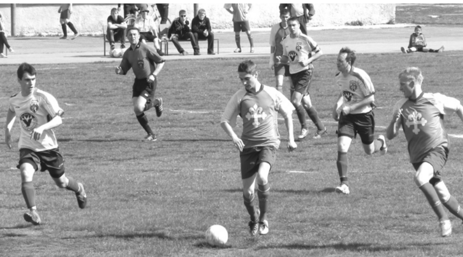
Матч «Факела» (Богданович) с «Факелом» (Первоуральск).

Несмотря на неудачу в этих играх, болельщики уверены, что победы у нашей команды еще будут.