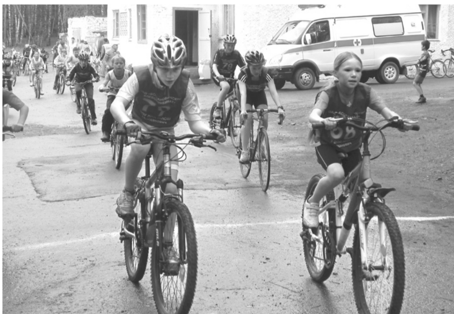
Этап езды на велосипеде первого забега.