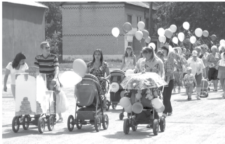
Праздничное шествие в Коменках открыли новорожденные в колясках.