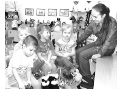
Выполнение проектных работ по строительству детского сада на 135 мест с вводом в эксплуатацию в 2012 году и предпроектная подготовка по детскому саду на 270 мест.