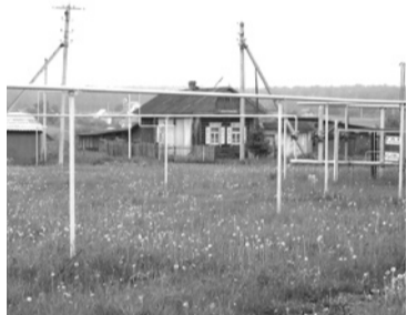
Строительство наружных газопроводов протяженностью 21,4 км.