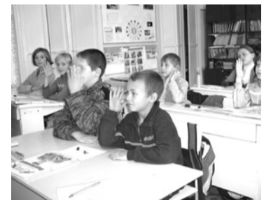
Ремонт Троицкой средней общеобразовательной школы.