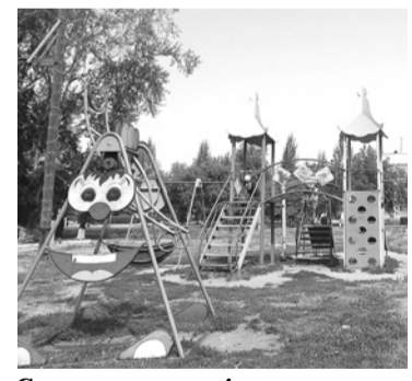
Строительство 4-х дворовых площадок по губернаторской программе «1000 благоустроенных дворов» на 2011–2015 гг.