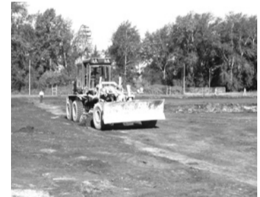
Ввод в эксплуатацию футбольного стадиона с искусственным покрытием на ул. Парковой, 10, в г. Богдановиче.