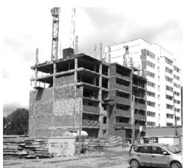
Ввод в эксплуатацию 83-квартирного дома на ул. Кунавина в г. Богдановиче.

Ежегодно администрация нашего городского округа разрабатывает программу социально-экономического развития. И по итогам каждого квартала регулярно публикует отчет о выполнении этой программы.