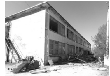
Восстановление детского сада № 38 на 90 мест.