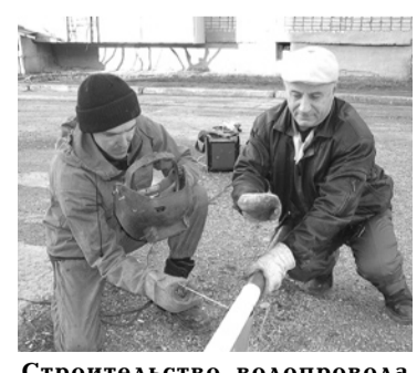
Строительство водопровода для подключения с. Коменки к системе водоснабжения г. Богдановича (3 км).