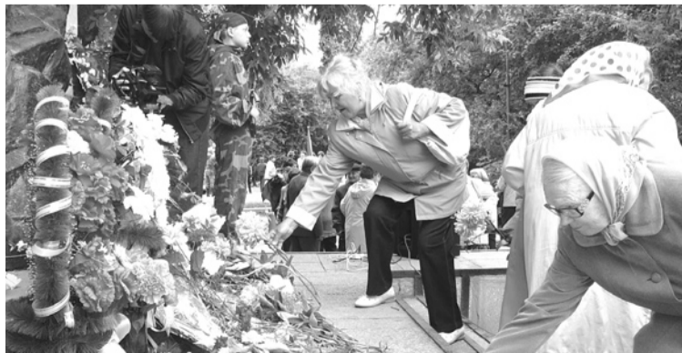
Возложение цветов у монумента погибшим воинам-землякам у ТЦ «Спутник».