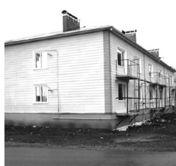
Ввод в эксплуатацию 12-квартирного дома в п. Полдневом (снос последнего барака).

Когда руководство муниципалитета всерьез озабочено будущим территории, если оно хочет и может отстаивать ее интересы, оно найдет поддержку властных институтов и может рассчитывать на реальный успех.