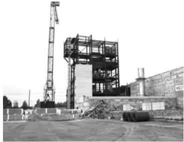
Пуск завода по производству теплоизоляционных плит на основе базальтового волокна.