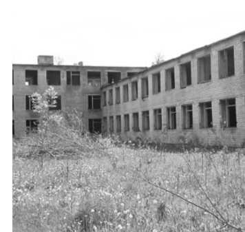
Реконструкция здания водогрязелечебницы под детский сад на 90 мест.