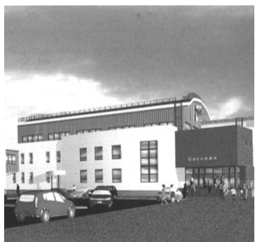
Начало строительства бассейна – вторая очередь многофункционального спортивного центра.