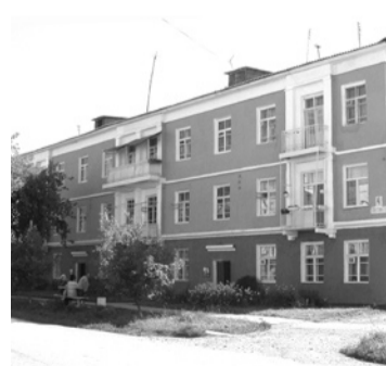
Капитальный ремонт многоквартирных домов по 185-ФЗ на сумму 50 млн рублей.