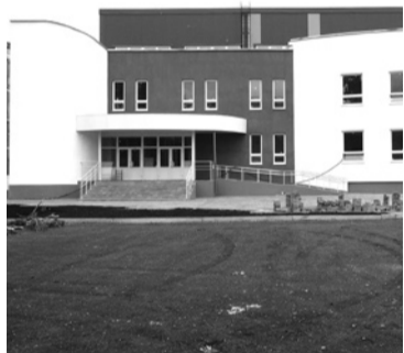
Ввод в эксплуатацию первой очереди многофункционального спортивного центра.