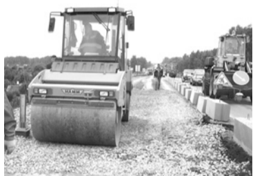
Реконструкция автомобильной дороги по улице Кунавина в г. Богдановиче.