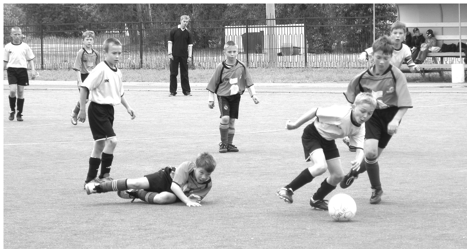
Момент финальной игры команды «Удача» (Каменск-Уральский) с «Сигналом» (Артемовский).