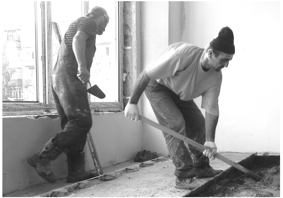
Строители ООО «Строймонтаж Урал-2000» выполняют стяжку пола.