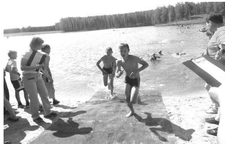
После плавания участники бегут на второй этап дистанции – езда на велосипеде.