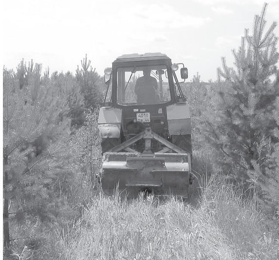
Ведется механизированный уход за лесными культурами.