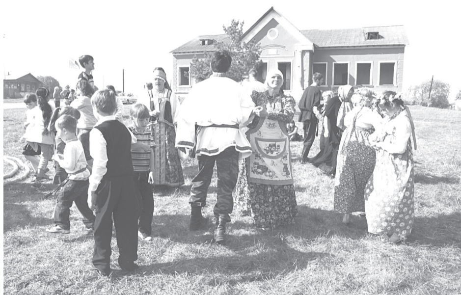
Плясать веселую кадрили молодое поколение научилось быстро.