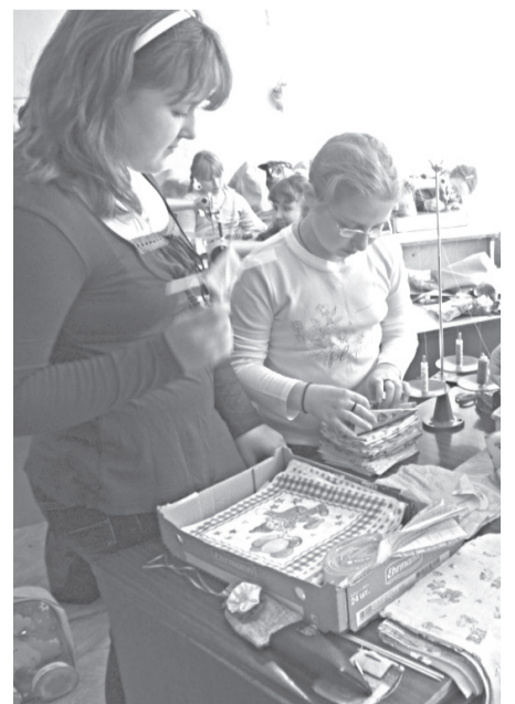
Швейная мастерская лагеря при школе № 2 презентовала на мероприятии шитье своими руками изделия.