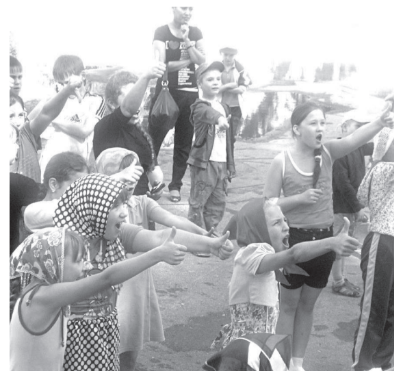
Дети в восторге от летних каникул.