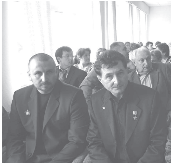
Представители общественных организаций собрались для конструктивного диалога с губернатором.