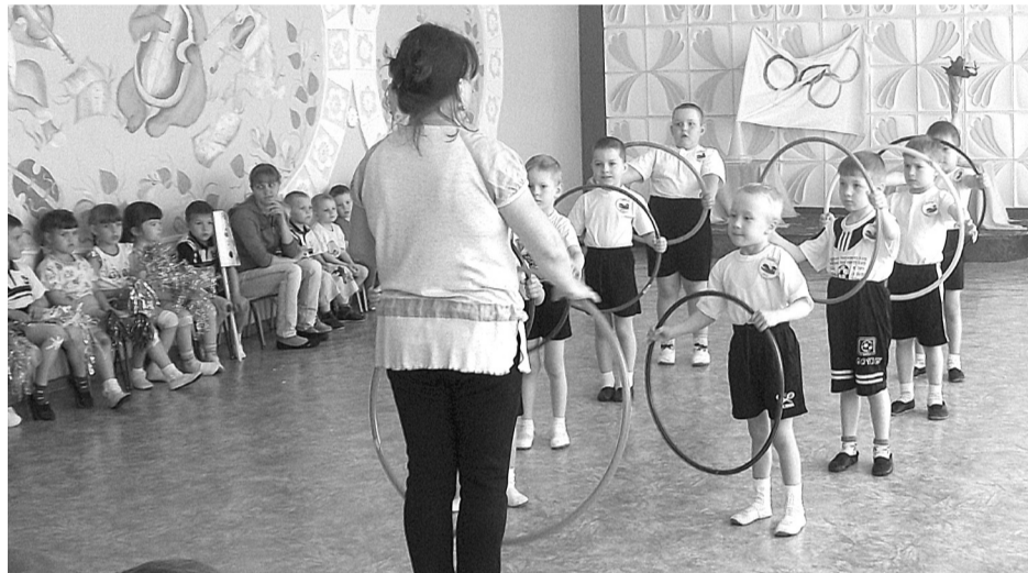
Каждые пять дней Олимпиады воспитанники детского сада № 15 состязались в скорости, меткости и выносливости. На снимке команда «Рваный кед».

Пять дней дети соревновались и выясняли: кто лучший в кроссе, в прыжках в длину, в метании и в других спортивных состязаниях.