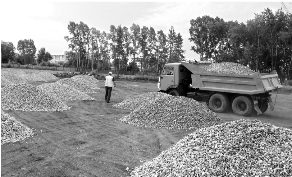
МУП «Благоустройство» завозит щебень на будущее футбольное поле.