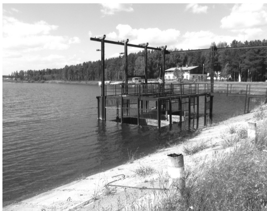
Паршинский пруд – излюбленное место отдыха богдановичцев.