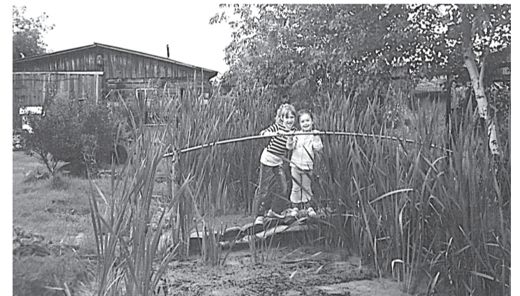
Пруд с камышами – любимое место игр внуков Аптиных.

и большой теплице, дающей щедрый урожай... Цветы же на участке Аптиных благоухают все лето, даря хозяевам только хорошее настроение.