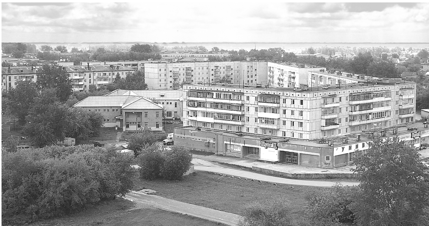
Панорама города с высоты строящейся девятиэтажки на Кунавина, 9.