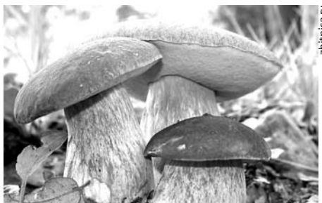
СПЕЦВЫПУСК: В РАЗГАРЕ СЕЗОНА СБОРА ГРИБОВ