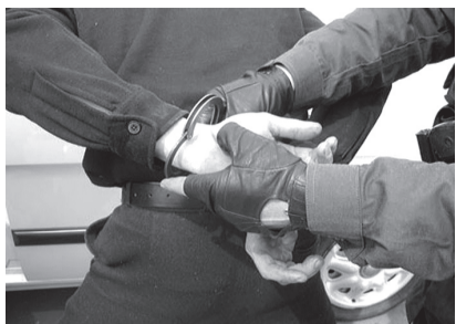
В БОГДАНОВИЧЕ ЗАДЕРЖАН РЕАЛИЗАТОР ГЕРОИНА