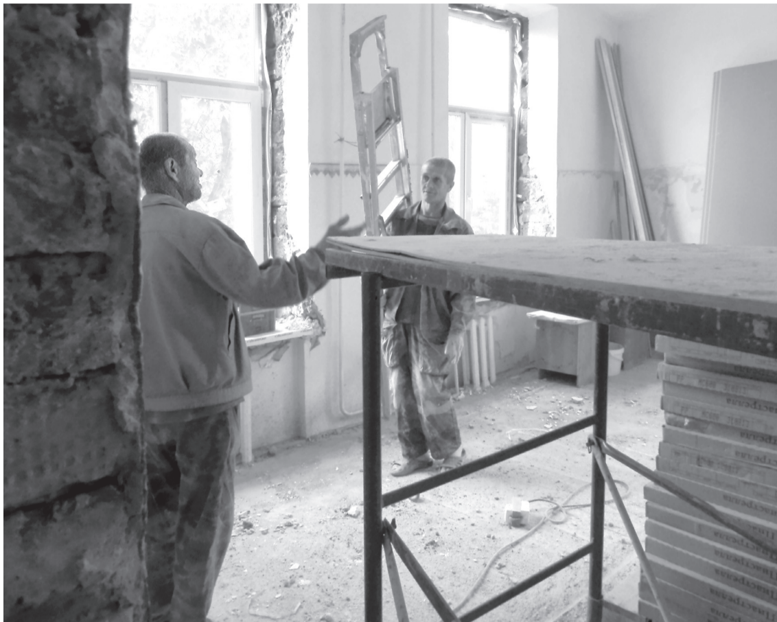
На втором этаже хирургического корпуса отделочные работы проводят работники ООО «Стройарт» и ООО «СРК» из Екатеринбурга.