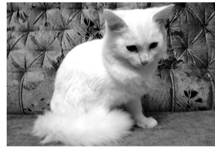
Этот котик ждёт своих хозяев.