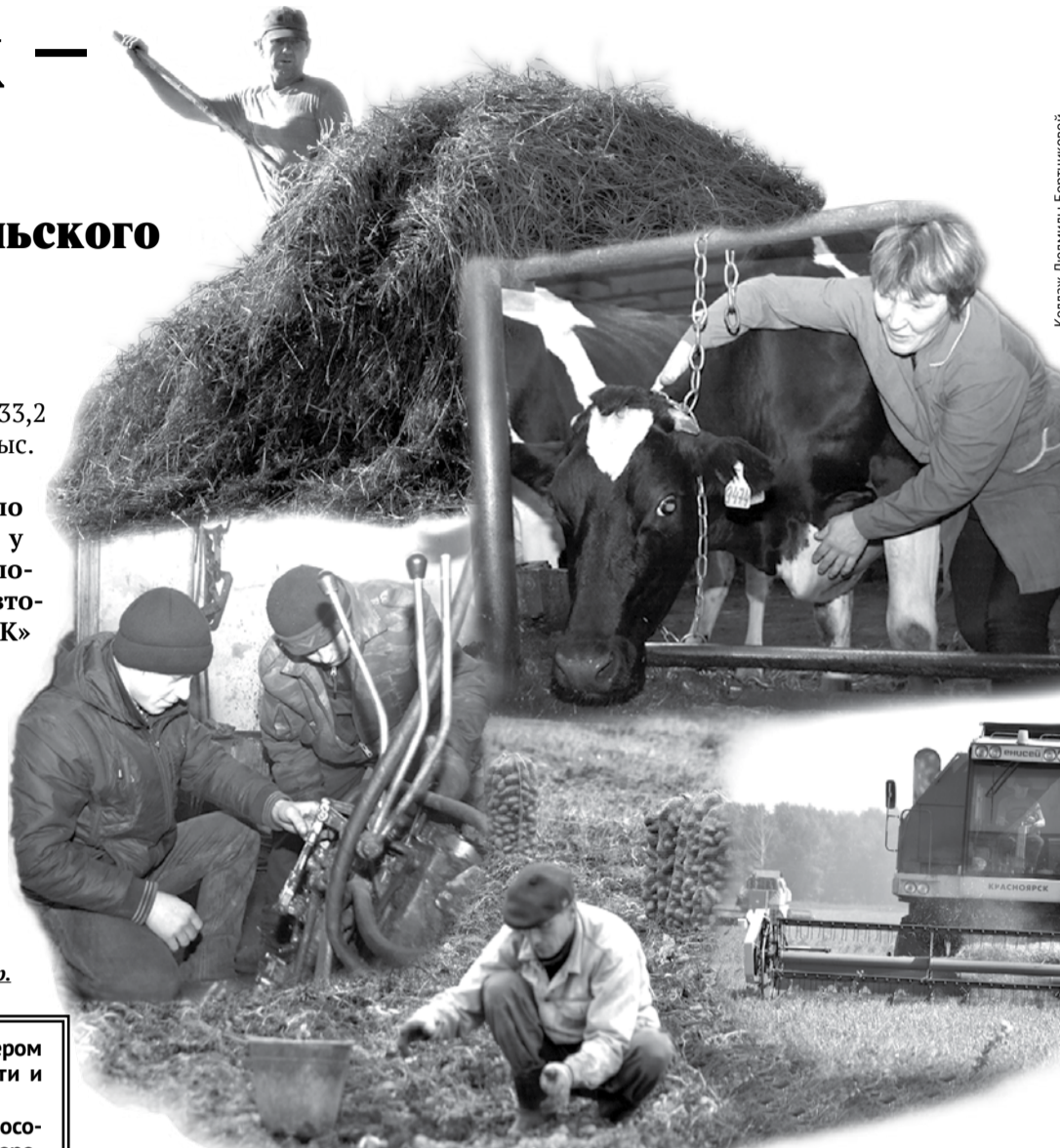
Коллаж Людмила Бортыковой.

Без выходных и отпусков трудятся сельчане, чтобы на наших столах всегда были хлеб, молоко, мясо и другие продукты.