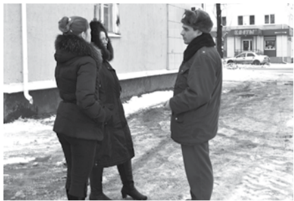
СВОЕГО УЧАСТКОВОГО ЗНАЙТЕ В ЛИЦО