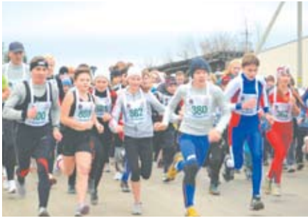
В СУББОТУ СОСТОИТСЯ ЛЕГКОАТЛЕТИЧЕСКИЙ ПРОБЕГ