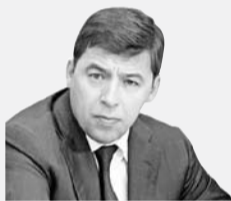
Губернатор Свердловской области Евгений Куйвашев:

– Особое внимание в области уделяется улучшению жилищных условий многодетных и молодых семей. Размер социальных выплат зависит от количества детей и от стоимости жилья. За два года семьи получили выплаты на общую сумму более 2 млрд. рублей.