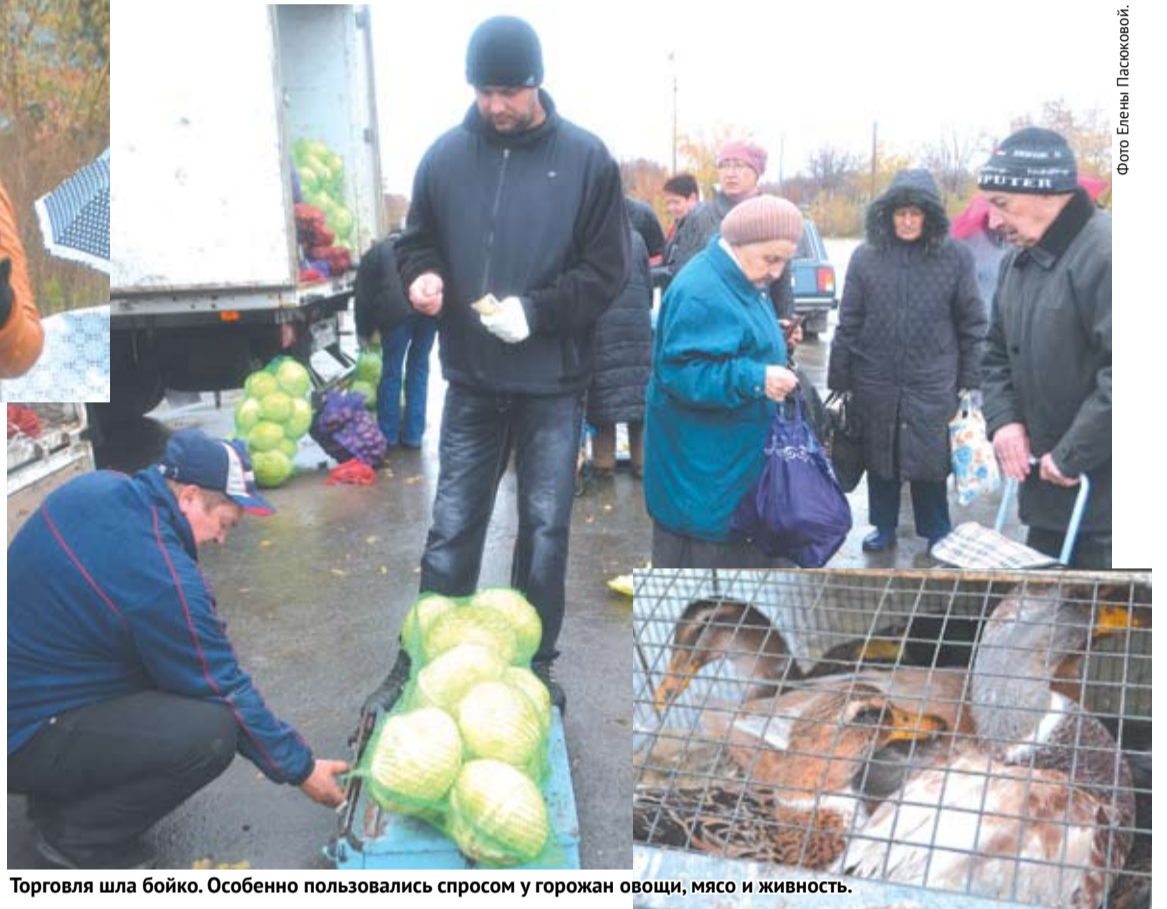
Торговля шла бойко. Особенно пользовались спросом у горожан овощи, мясо и живность.