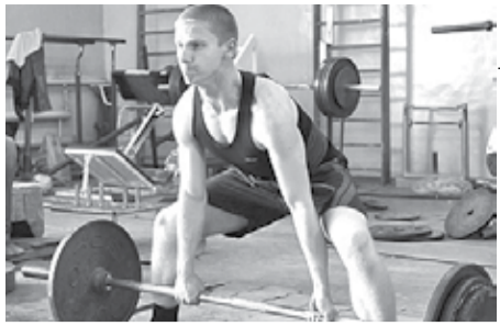
НАШИ АТЛЕТЫ - ЧЕМПИОНЫ МИРА