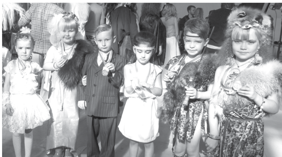
Своё парикмахерское искусство учащиеся техникума демонстрировали на моделях, которые по итогам конкурса получили медали «Юная модель».