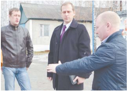
Богданович посетил замминистра физкультуры, спорта и молодежной политики Стр. 2-3.