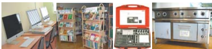
Продолжение темы на 3-й стр.