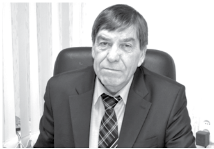
ПРЕДСЕДАТЕЛЬ ДУМЫ ГО ОТВЕТИЛ НА ВОПРОСЫ БОГДАНОВИЧЦЕВ