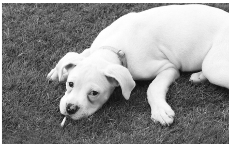
Мой хозяин курит. Я тоже курильщик... пассивный.