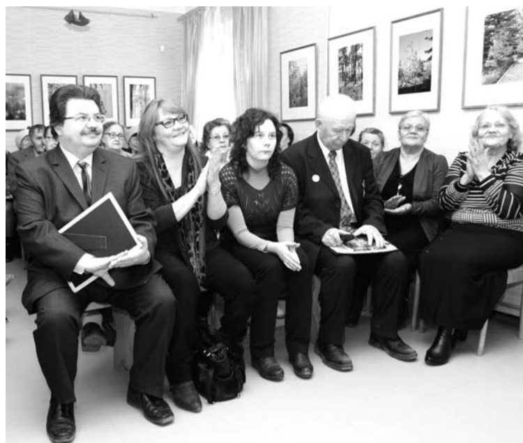
Зрители с особым интересом слушали стихи богдановичских поэтов.

Следует отметить, что скромные площади литературной гостиной музея в этот день не могли вместить всех желающих присутствовать при чтении стихов.