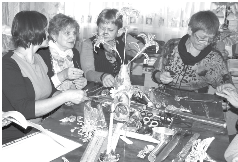
Учителя технологии ГО Богданович на мастер-классе узнали приемы работы с фольгой и с увлечением сделали из нее прекрасные цветы и украшения.

УЧИТЕЛЯ технологии у девочек были приглашены в дворовый клуб «Вдохновение» школы № 1.