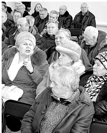
Из зала поступило много вопросов.

Тем не менее администрации удалось сохранить свое участие во всех целевых программах, в которые она была включена еще в 2011 году. Были отремонтированы пять придомовых территорий, пять дворовых проездов, проведен текущий ремонт проезжей части улиц Октябрьской, Первомайской и 8 Марта. В котельной Барабы были заменены котлы, отремонтирована Байновская котельная, переданная на баланс муниципалитета, пущен газ в Ильинском, в том числе газифицированы и объекты социальной сферы. Были продолжены работы по газификации Троицкого, Чернокоровского, Тыгиша и Богдановича. МУП «БТС» с прошлого года осуществляет эксплуатацию всех котельных городского округа, за исключением котельной ОАО «Огнеупоры». Часть котельных досталась муниципалитету в «аховом» состоянии, но они были