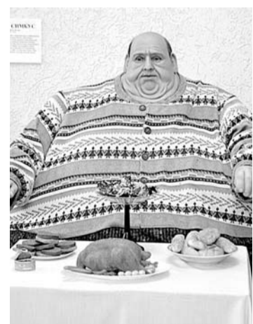
Самый толстый в мире человек - один из главных героев выставки.