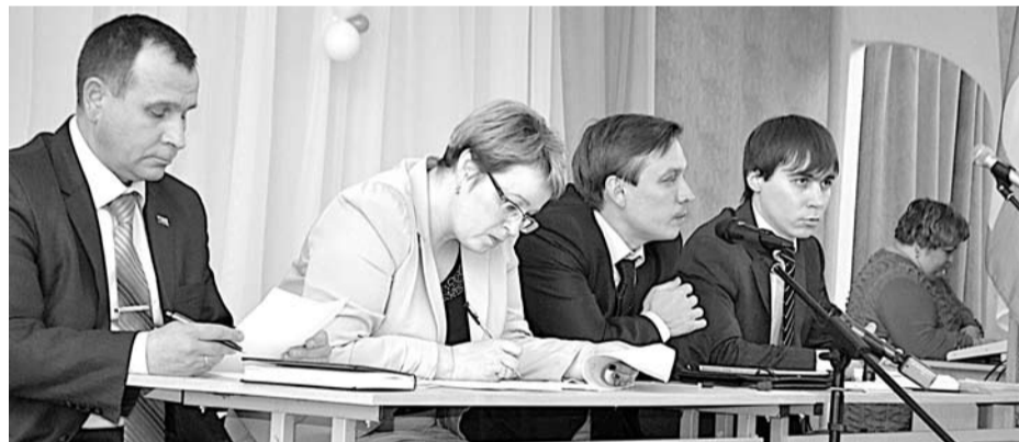
Представители администрации ГО Богданович внимательно слушали вопросы собравшихся и отвечали на каждый из них.