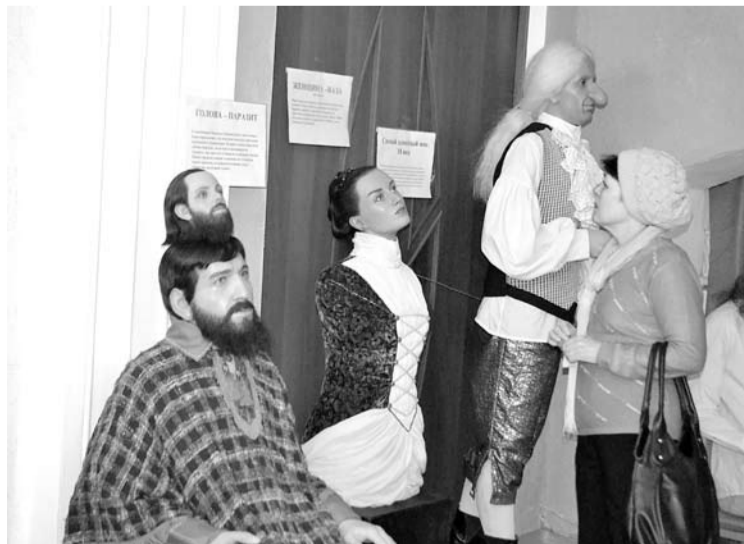
Словно живые, музейные экспонаты следят за посетителями интересной и необычной выставки.