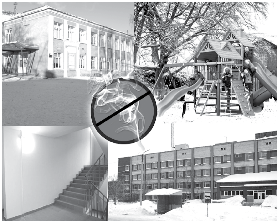
Коллаж Марины Бурлаковой