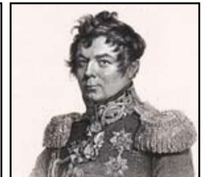
Иван Иванович Дибич (1785-1831) За успехи в Русско-турецкой войне 1828–1829 годов.