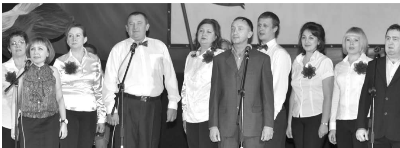
«Битва хоров», которая прошла в ноябре, собрала в ДиКЦ полный зал зрителей. Работники управления физической культуры и спорта доказали, что в спорте бывают и певческие таланты.

День сотрудника ОВД по традиции начался торжественным построением. Затем полицейские почтили память погибших сотрудников.