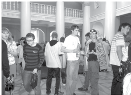
В БОГДАНОВИЧЕ ПРОЙДЕТ МОЛОДЕЖНЫЙ ФОРУМ Стр. 4.