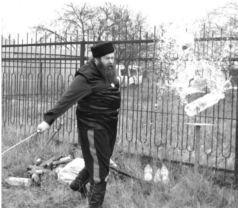
Казачи зря шашками не машут. На празднике, посвященном Дню народного единства, представители казачества показали свои умения управляться с этим оружием в мирных целях.