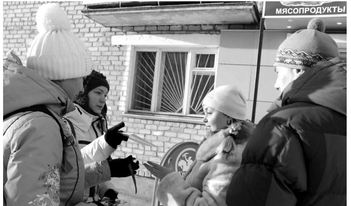
1 декабря молодежные объединения Богдановича в течение часа проводили на улицах агитацию, посвященную профилактике СПИДа. В частности, девушки из «Атома» дарили горожанам буклеты о профилактике ВИЧ/СПИДа.

Молодежные объединения приняли участие в акции «Выбери жизнь», проходившей на улицах города