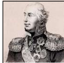
Михаил Илларионович Голенищев-Кутузов (1745–1813) 12 декабря 1812 года за победу в Отечественной войне 1812 года.