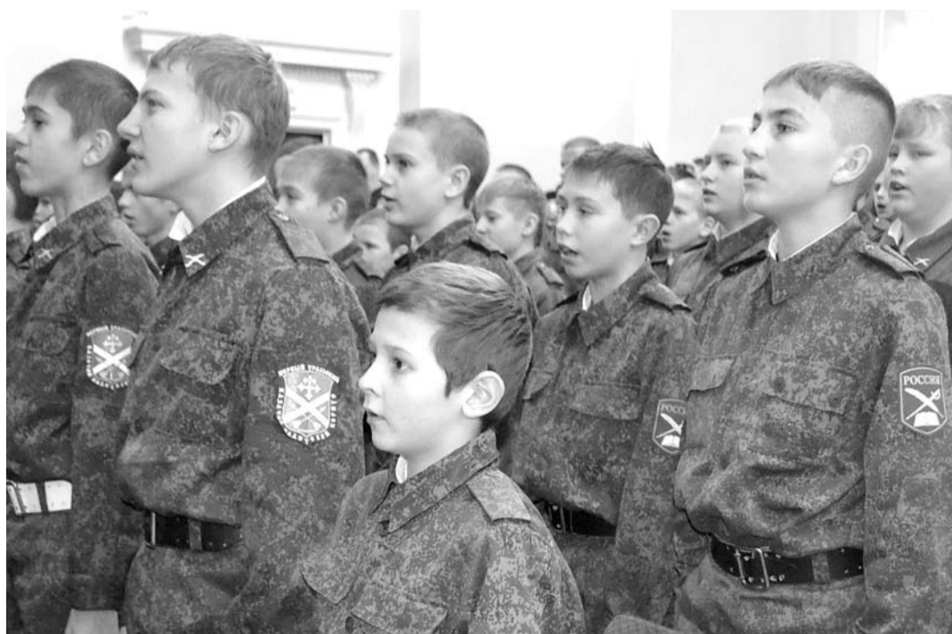
В ноябре в Богдановиче стало на 91 кадета больше. Ребята приняли присягу и поклялись быть честными и добросовестными кадетами.