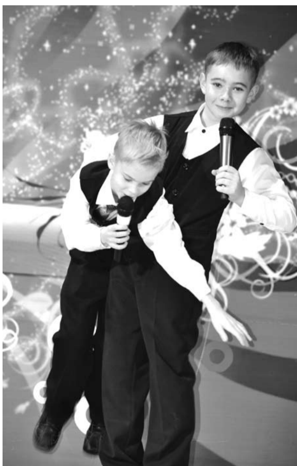
Школьники нашего округа запросто могут рассмешить зрительный зал. Тому доказательство – «КВН-школьная лига».