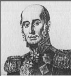
Михаил Богданович Барклай-де-Толли (1761–1818) 18 августа 1813 года в сражении под Кульмом (Богемия, ныне Чехия).