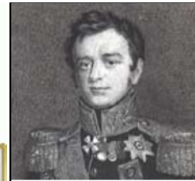
Иван Федорович Паскевич (1782-1856) В 1829 году за взятие турецкого города Эрзерума в Русско-турецкой войне 1828–1829 годов.