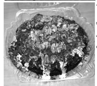
Лучшими из тортов-новинок предприятия являются торт «Абрикосовый рай» (вверху) и «Пицца богов» (внизу).