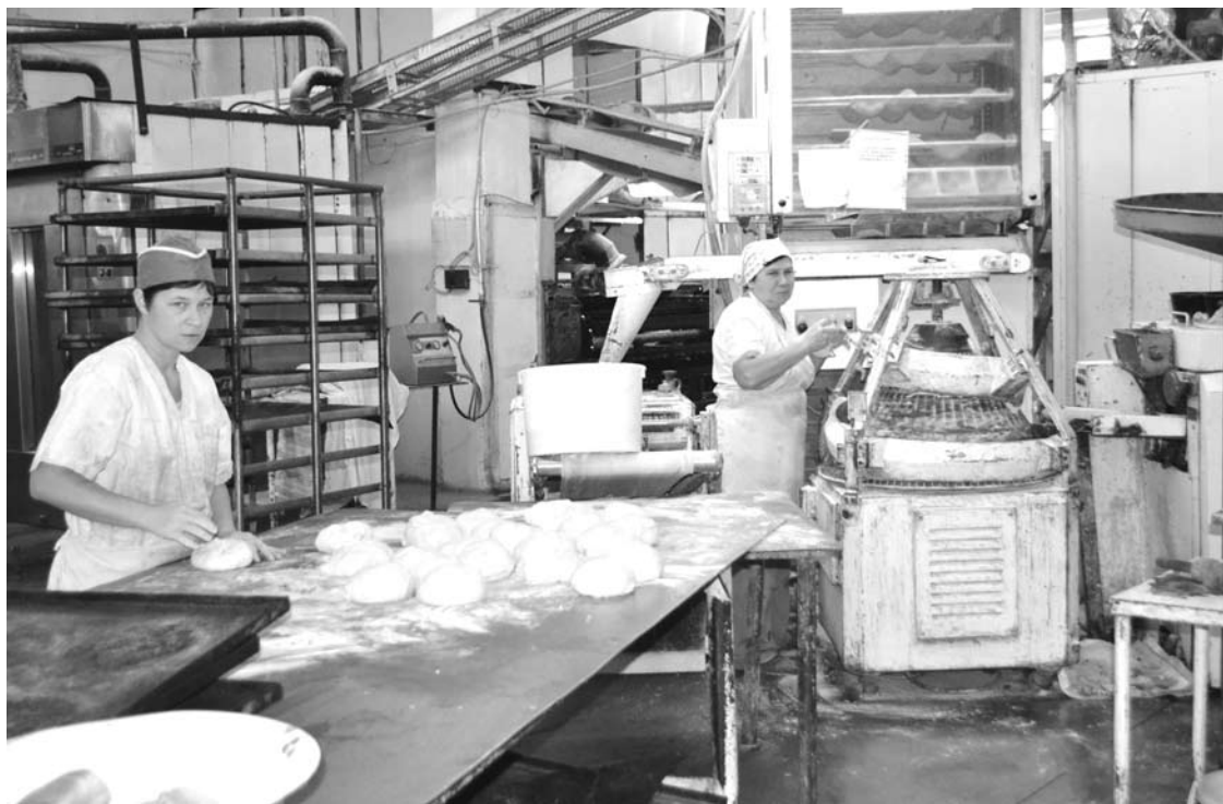
Формовка самого популярного в Богдановиче хлеба «Дарницкий».

- По объёмам продаж по-прежнему лидирует хлеб «Дарницкий». Радует то, что на фоне снижения потребления формового хлеба в рост пошли продажи вкусовых хлебов. Кроме того, потребители уже устали от массовых (штампованных) тортов, выпускаемых крупными кор-