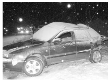
Снег, темное время суток, опасная дорога – и снова гибель. Может, этот случай станет уроком другим водителям.

В результате дорожно-транспортного происшествия водитель автомобиля «Toyota Caldina» погиб на месте ДТП до приезда маши-