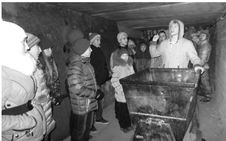
Экскурсовод познакомил ребят с шахтой и продемонстрировал принцип работы вагонетки.

ЧТО ТАКОЕ «золотая лихорадка» - знают все, но мало кто знает, что в России она началась в скромном городе Берёзовском, что в 12 километрах от Екатеринбурга. Учащиеся 7-в класса школы № 5 побывали на экскурсии в Берёзовском и окунулись в шахтёрскую реальность.