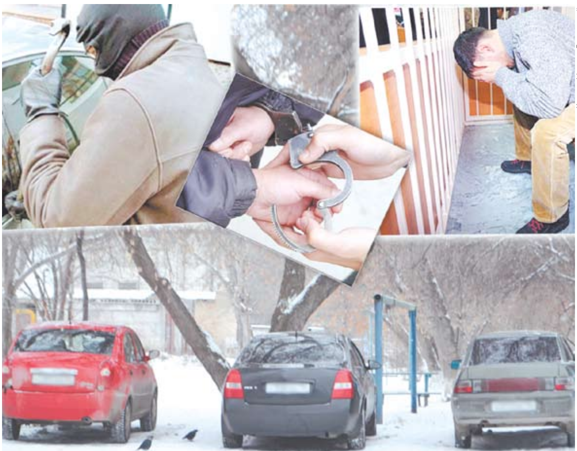
Автомобили зачастую безоружны перед угонщиками, и только хозяева могут их защитить. Любителям чужих машин стоит помнить о том, что далеко не на своем «коне» не уедешь.