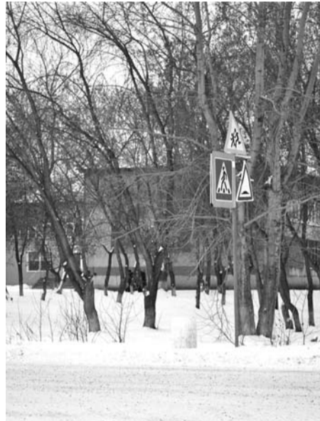
Тротуар на участке от ул. Новаторов до ул. Перепечина будет обустроен в 2014 году. Пешеходный переход возле школы № 4 уже обустроен.