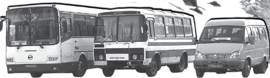
В отличие от села, в городе наполняемость автобусов значительна весь день.