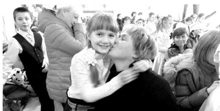
Праздник, посвященный Дню матери, в Тыгишской школе получился очень добрым и трогательным.

УЧАЩИЕСЯ начальных классов Тыгишской школы пригласили мамочек на праздник «Милой маме я дарю...».